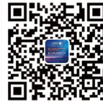
大会官方微信二维码