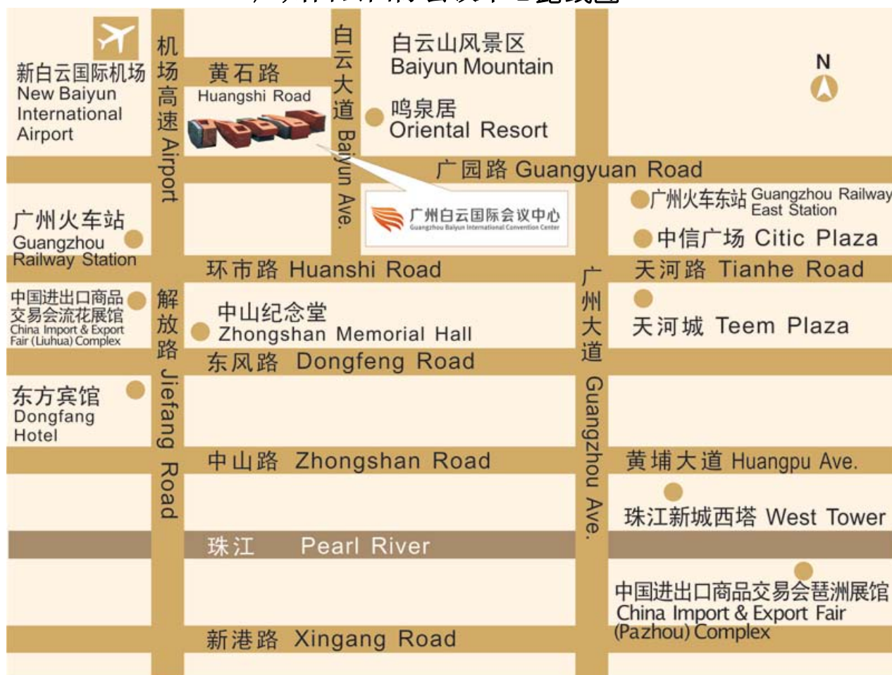
广州白云国际会议中心路线图