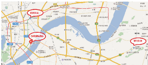
杭州国际会议中心（洲际酒店）（杭州市江干区解放东路2号）