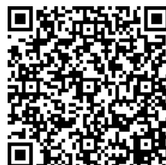
广东省医学会第一次精准医学 与分子诊断高峰论坛微官网