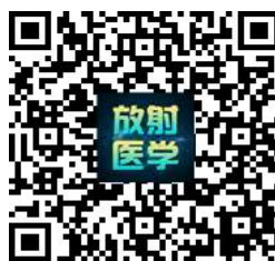
第十六次放射医学学术会议 暨第六次影像技术学学术会议微官网