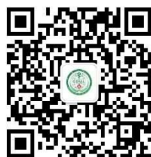
广东省医学会学术交流

有关会议最新消息欢迎浏览广东省医学会网站： www.gdma.cc 或关注微信公众平台。