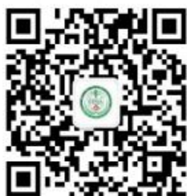
广东省医学会学术交流