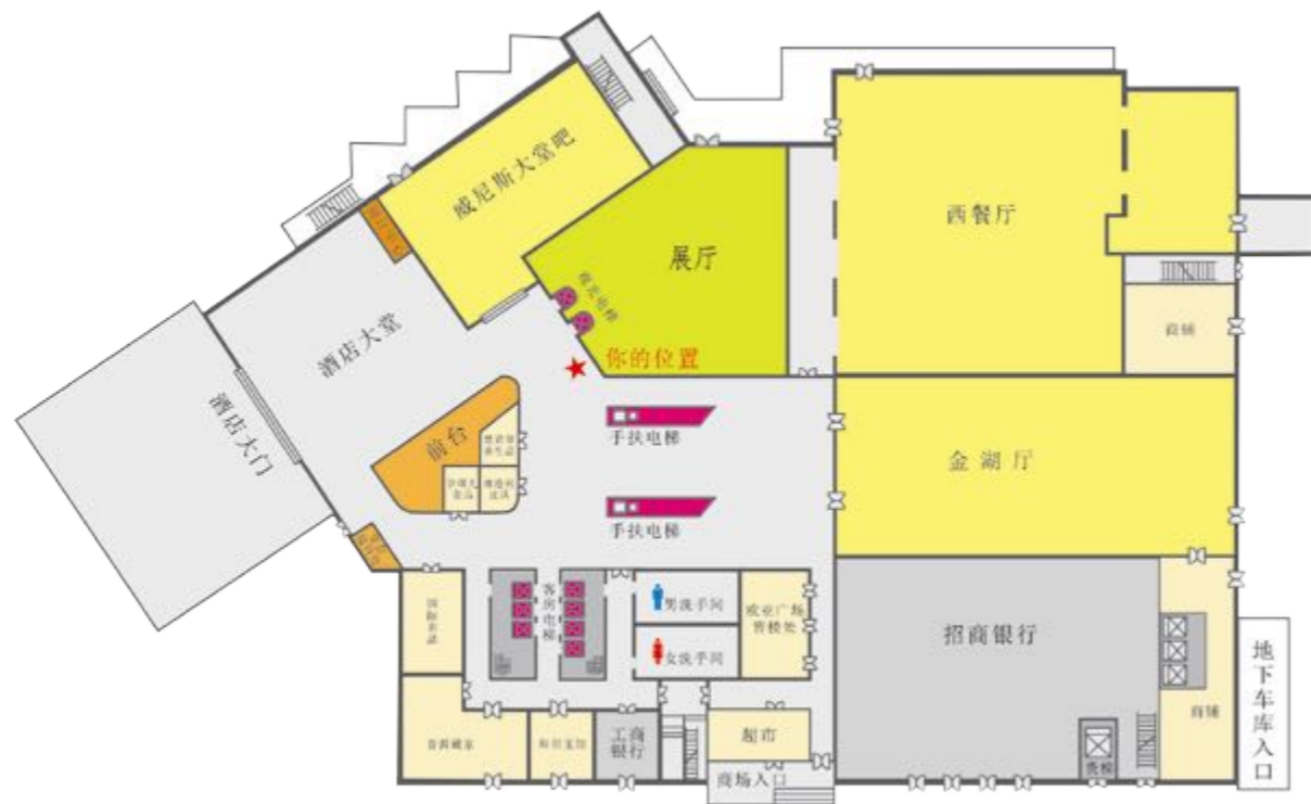
酒店一楼平面示意图