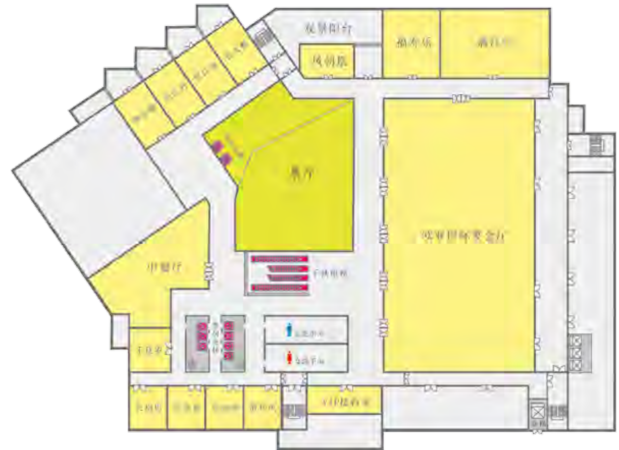
酒店二楼平面示意图